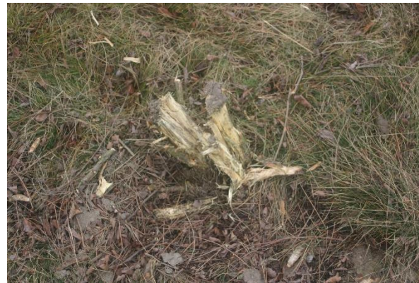
Abbildung 2: Durch die Beerntung mit einem Feldhäcksler aufgespaltene Wurzelstöcke der Robinie