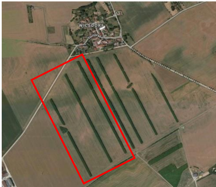
Abbildung 7: Übersichtskarte der geernteten Agroforststreifen

Die Ernte gestaltete sich besonders schwierig und problematisch. Dies ist auf verschiedene Faktoren zurückzuführen. Die Fläche wurde nach der letzten Ernte nicht gepflegt, Bäume standen z.T. außerhalb der Reihen, diese haben die Traktoren bei der Ernte und beim Abfahren der Bäume behindert. Auch große Wurzelstücke außerhalb der Pflanzreihen lagen auf der Fläche verteilt und behinderten die Ernte zusätzlich. Ebenso die älteren und somit breiteren Wurzelstöcke mit 3 bis 10 Trieben pro Wurzelstock stellten ein weiteres Hemmnis für die Beerntung dar und brachten die Erntetechnik an ihre Grenzen.