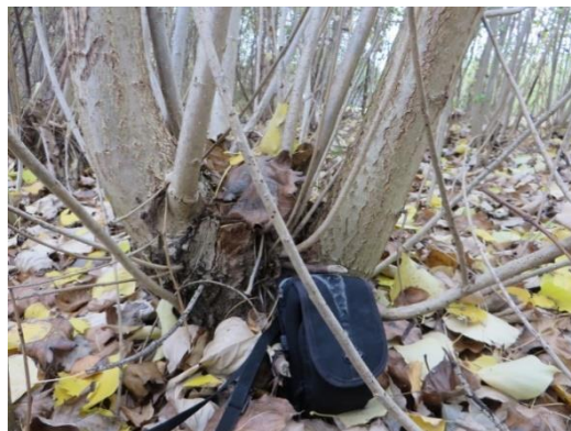
Abbildung 8: Wurzelhals in einem zu erntenden Agroforststreifen in Dornburg

Die Ernte gestaltete sich besonders schwierig und problematisch. Dies ist auf verschiedene Faktoren zurückzuführen. Die Fläche wurde nach der letzten Ernte nicht gepflegt, Bäume standen z.T. außerhalb der Reihen, diese haben die Traktoren bei der Ernte und beim Abfahren der Bäume behindert. Auch große Wurzelstücke außerhalb der Pflanzreihen lagen auf der Fläche verteilt und behinderten die Ernte zusätzlich. Ebenso die älteren und somit breiteren Wurzelstöcke mit 3 bis 10 Trieben pro Wurzelstock stellten ein weiteres Hemmnis für die Beerntung dar und brachten die Erntetechnik an ihre Grenzen.