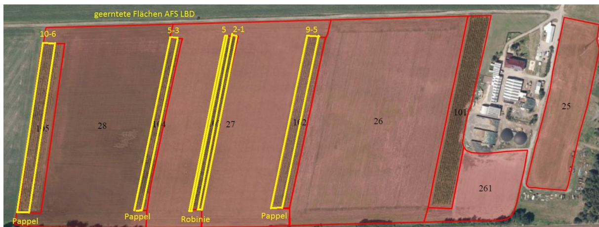
Abbildung 6: Übersichtskarte der teilweise geernteten Agroforststreifen in Peickwitz

Bei der Ernte hat sich gezeigt, dass der hohe Anteil an Randreihen sich negativ auf diese auswirkt. Die Bäume haben ein höheres Lichtangebot und wachsen verstärkt nach außen, wodurch bei der Ernte die Bäume schlechter eingezogen werden und vereinzelt nach außen fallen. Die Erntemaschine muss bei der Ernte der Randreihen langsamer fahren und es kommt zu Verstopfungen des Ernteaggregates, die Ernteleistung sinkt und die Ernte wird teurer.