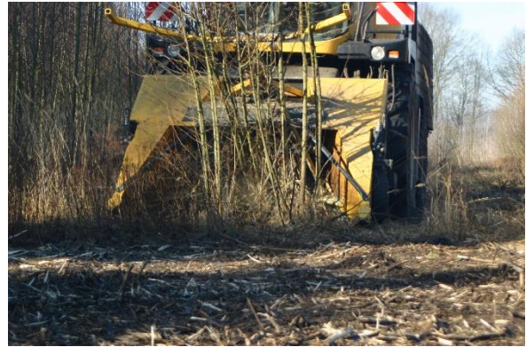
Abbildung 1: Feldhäcksler mit Gehölzgebiss der Fa. New Holland