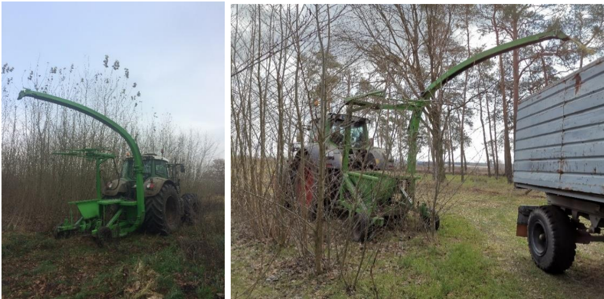
Abbildung 3: Mähacker MH 130 der Firma Kluge im Heckenbau

Die Verfügbarkeit der Technik in Deutschland ist sehr unterschiedlich und noch nicht flächendeckend. Auch Erntedienstleister selbst sind bisher nur regional verfügbar.