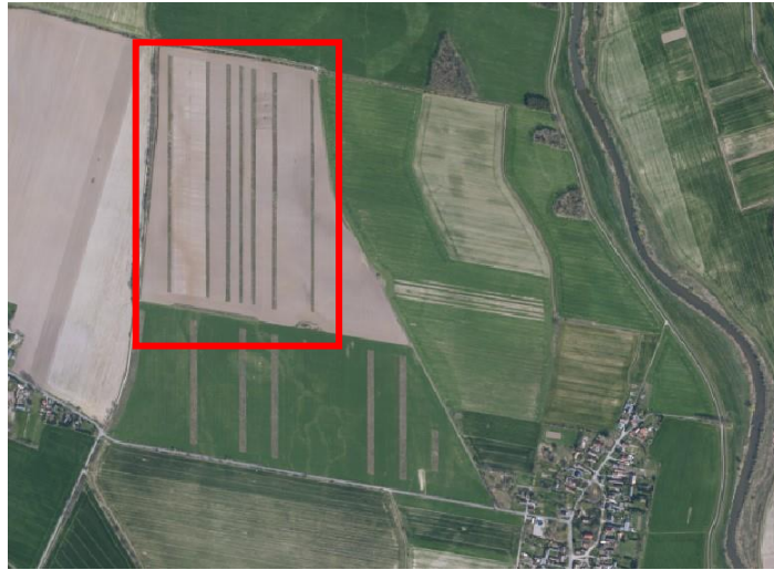
Abbildung 5: Übersichtskarte der Agroforstsysteme bei Forst