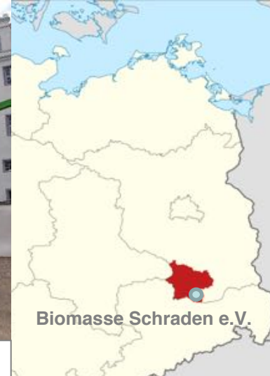
Biomasse Schraden e.V.