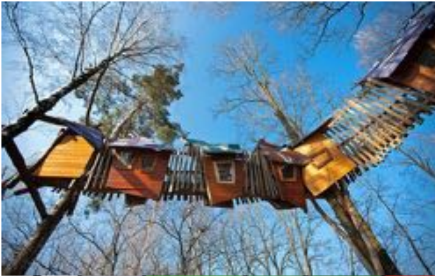
Kulturinsel Einsiedel, Landkreis Görlitz