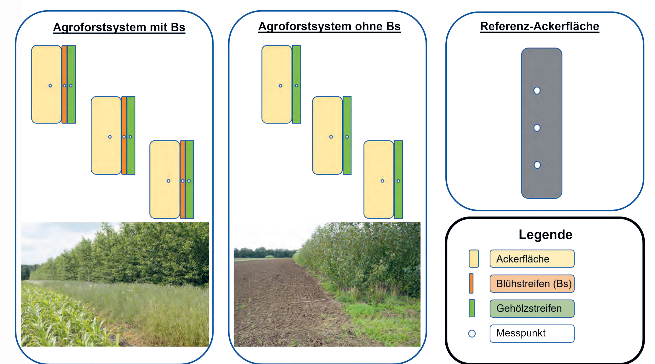
Abbildung 3: Versuchsaufbau von SEBAS (vereinfachte Darstellung)

Es werden folgende Untersuchungsparameter betrachtet: Insekten, Vegetation, Mikroklima, Boden, Ökosystemleistungen