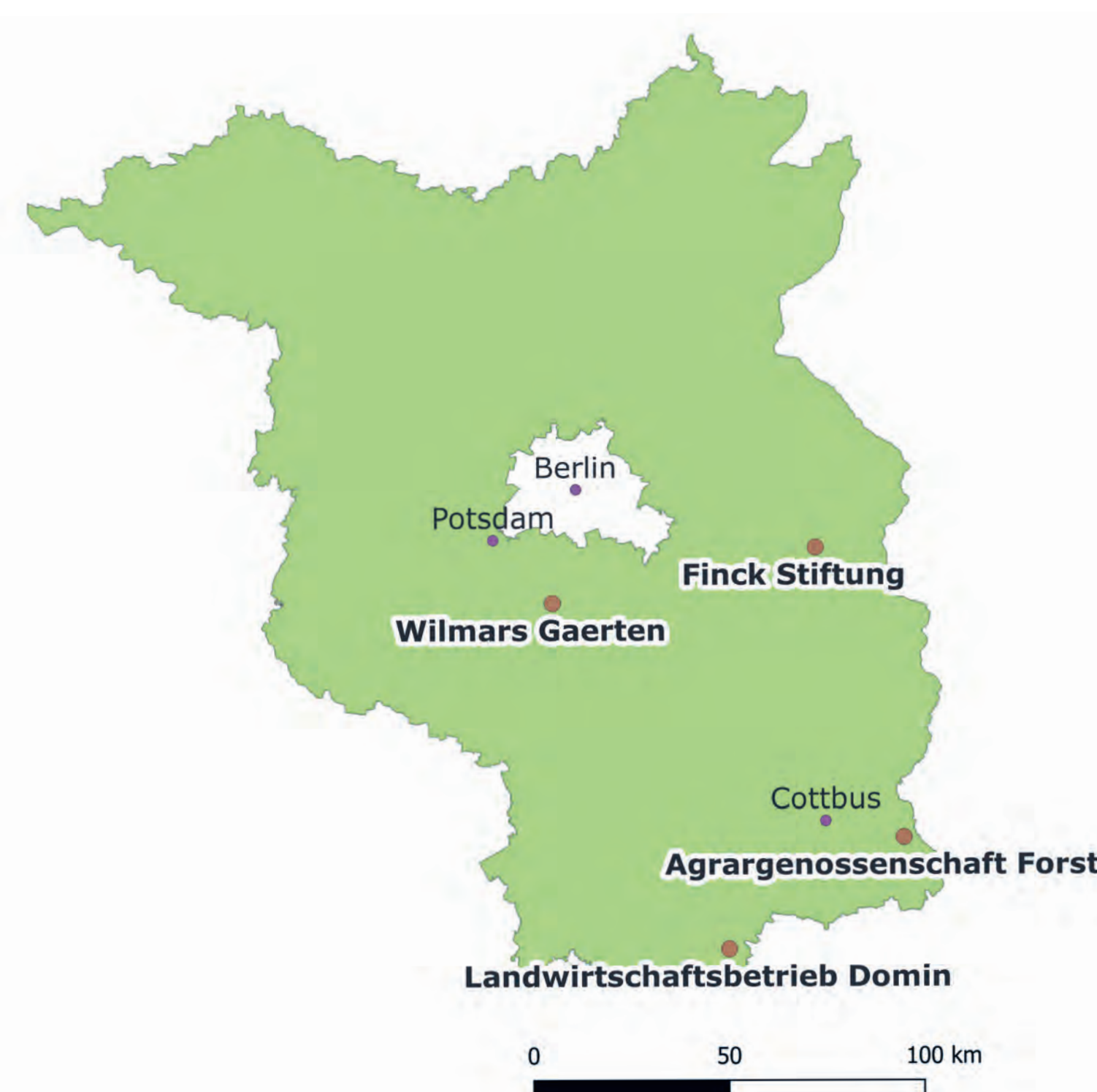
Abbildung 2: Lage der Untersuchungsflächen von SEBAS

Die Untersuchungen erfolgen auf Agroforstflächen von vier Landwirtschaftsbetrieben in Brandenburg. Als Referenz dienen Ackerschläge ohne Gehölzstrukturen. Diese befinden sich in Nachbarschaft der Agroforstfläche und werden mit Blick auf die Ackerkulturen identisch bewirtschaftet.