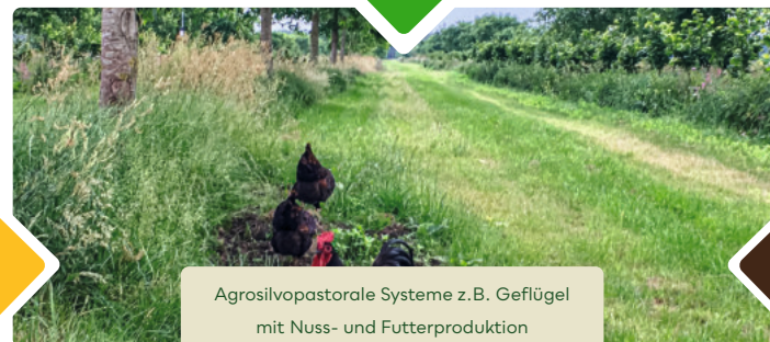
Agrosilvopastorale Systeme z.B. Geflügel mit Nuss- und Futterproduktion