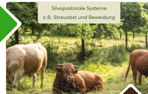
Silvopastorale Systeme z.B. Streuobst und Beweidung