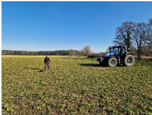
Einmessen der Streifen auf der ersten Modellfläche am Biohof Ritzleben durch Karsten Bauer (Agroforst-Altmark).

Der Deutsche Fachverband für Agroforstwirtschaft (DeFAF e.V.) baut im Förderprojekt „Impulsbüro Altmark“ eine regionale Anlaufstelle für das Thema Agroforstwirtschaft auf. Agroforst-Modellflächen dienen dem Impulsbüro Altmark als Referenzbeispiele und als zukünftige Lern- und Bildungsorte zum Thema Agroforstwirtschaft. Vom 31. März bis 03. April wird die erste Modellfläche auf dem Biohof Ritzleben angelegt. Unterstützende und Mitmachende sind willkommen!