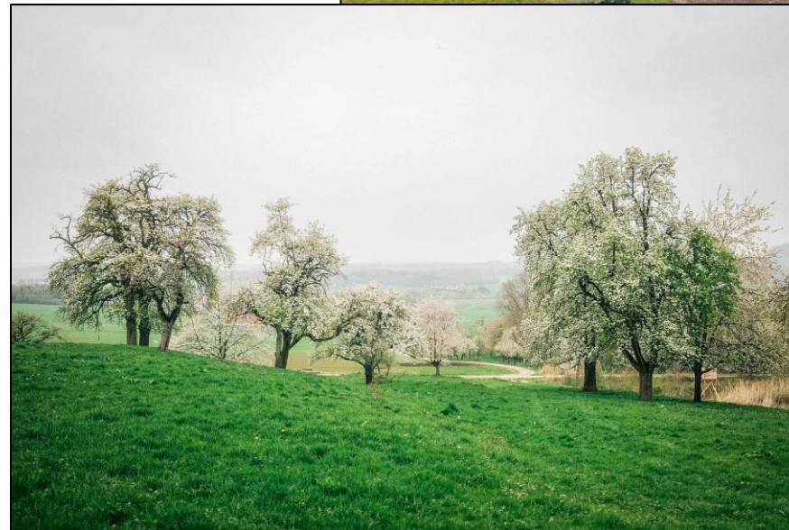
Pappelstreifen, Foto: Tobias Hoppe Obstbäume, Foto: Tom Köhn